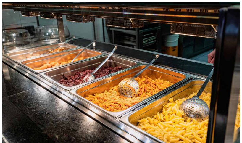
La vitrine Culinario Easy trouve idéalement sa place dans le concept gastronomique de l'Alte Brauerei à Celerina.