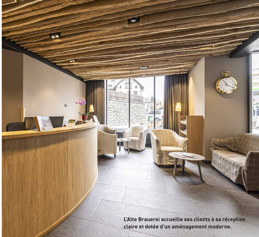
L'Alte Brauerei accueille ses clients à sa réception claire et dotée d'un aménagement moderne.

variée. Lorsque l'on entre dans le restaurant, on tombe tout d'abord sur une sympathique équipe en train de prendre le café à la «table des indigènes». La première de ces équipes vient ici à huit heures, la deuxième à neuf et la troisième à dix heures» nous explique le restaurateur Ralph Kübler. Merveilleux, pense-t-on! Les endroits où l'on rencontre des gens locaux sont toujours très intéressants. Les clients de l'hôtel assis aux tables d'à côté semblent partager cette opinion.