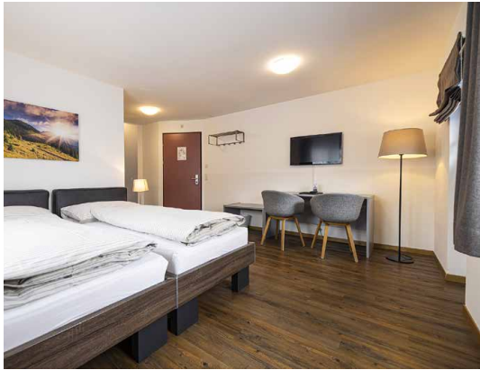
Les chambres confortables et dotées d'un aménagement moderne de l'Alte Brauerei répondent à toutes les exigences des différents cercles de clientèle.